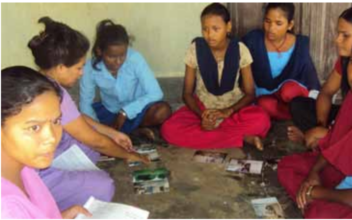
Photovoice : Filles discutant des photos qu'elles ont prises relatant à quoi la vie ressemble pour les garçons et les filles de leur communauté.